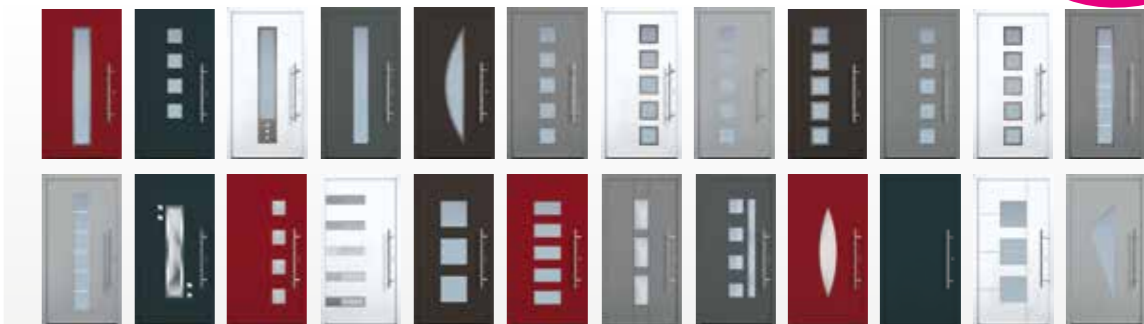
Ansicht der 24 Designvarianten gemäß Aktionsangebot

Weitere optionale Mehrausstattung gegen Aufpreis wählbar